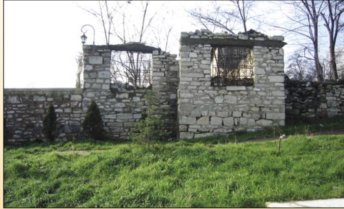
"Bir tarih yok oluyor... Karyağdı Ali Baba Bektaşî Tekesi" (Eyüp/İstanbul)