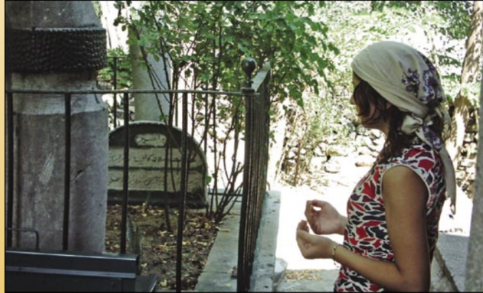
"Karyağdı Ali Baba ve dua eden kız" (Eyüp/İstanbul)